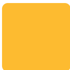
Giallo RAL 1023 Yellow, Gelb, Amarillo