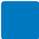
Blu RAL 5015 Blue, Blau, Azul