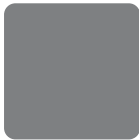
Grigio RAL 7037 Grey, Grau, Gris