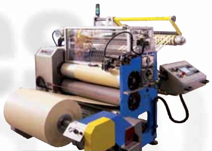
TG100 automatica 850 - 1000 - 1300 Taglierina ribobinatrice ad uno o due avvolgitori per bobine, bordi spessore max 2 mm, gestione ciclo di lavoro e campo di taglio automatico

Cortadora rebobinadora para cantos de grande espesor con un/dos arboles de rebobinado