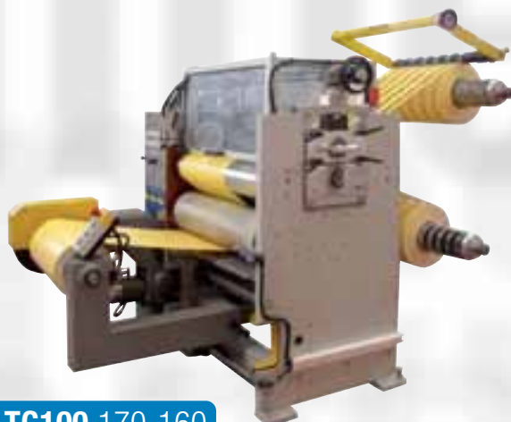
TG100 170-160 1000 - 1300 Taglierina ribobinatrice ad uno o due avvolgitori per bordi forte spessore

Cortadora rebobinadora para cantos de grande espesor con un arbol de rebobinado