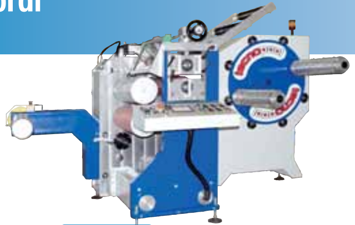
TG500 REV 500 - 750 Taglierina ribobinatrice per bordi forti spessori con due avvolgitori a revolver

Cortadora rebobinadora para cantos de grande espesor con un arbol de rebobinado