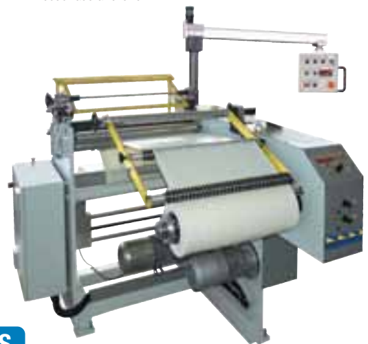
TG100/S 750 - 1000 Taglierina ribobinatrice monoavvolgitore per bordi a forte spessore

Cortadora rebobinadora para cantos de grande espesor con dos arboles de rebobinado