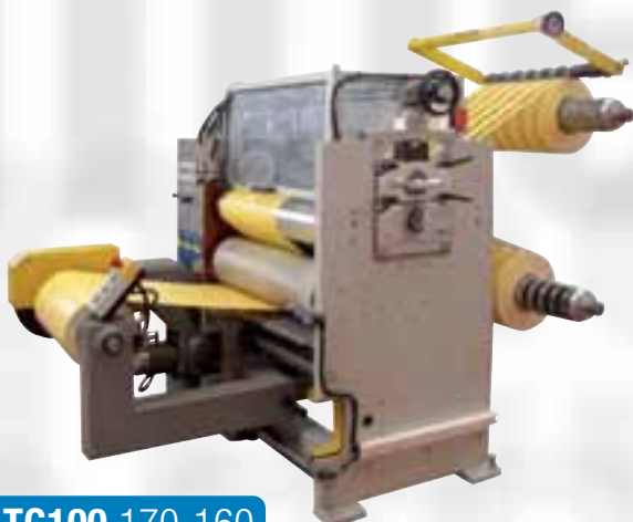
TG100 170-160 1000 - 1300 Taglierina ribobinatrice ad uno o due avvolgitori per bordi forte spessore

Cortadora rebobinadora para cantos de grande espesor con un arbol de rebobinado