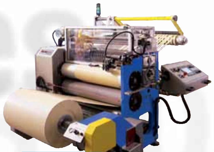
TG100 automatica 850 - 1000 - 1300 Taglierina ribobinatrice ad uno o due avvolgitori per bobine, bordi spessore max 2 mm, gestione ciclo di lavoro e campo di taglio automatico

Cortadora rebobinadora para cantos de grande espesor con un/dos arboles de rebobinado