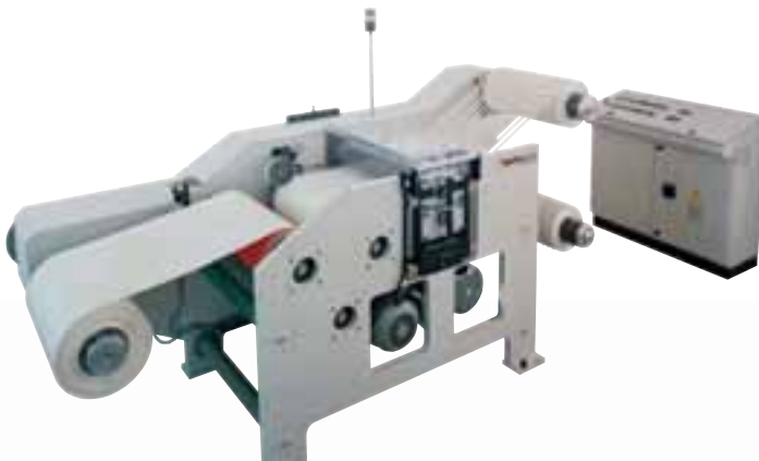
TG750 750 - 1000 Taglierina ribobinatrice per bordi forti spessori con due avvolgitori

Cortadora rebobinadora para cantos de grande espesor con dos arboles de rebobinado a revolver