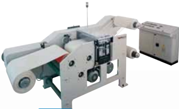
TG750 750 - 1000 Taglierina ribobinatrice per bordi forti spessori con due avvolgitori

Cortadora rebobinadora para cantos de grande espesor con dos arboles de rebobinado a revolver