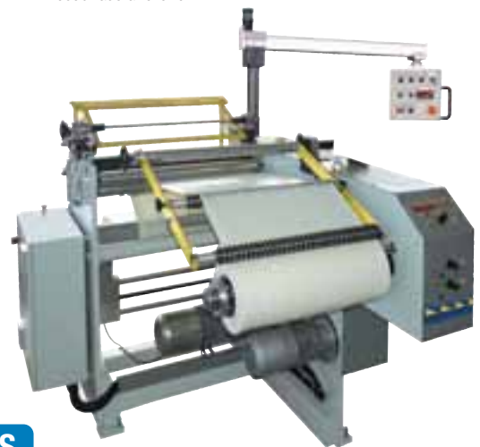
TG100/S 750 - 1000 Taglierina ribobinatrice monoavvolgitore per bordi a forte spessore

Cortadora rebobinadora para cantos de grande espesor con dos arboles de rebobinado