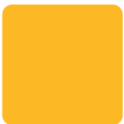
Giallo RAL 1023 Yellow, Gelb, Amarillo