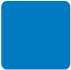
Blu RAL 5015 Blue, Blau, Azul