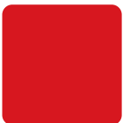
Rosso RAL 3020 Red, Rot, Rojo

Il costruttore si riserva il diritto di apportare modifiche tecniche senza alcun preavviso.