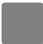
Grigio RAL 7037 Grey, Grau, Gris