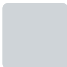
Grigio RAL 7035 Grey, Grau, Gris